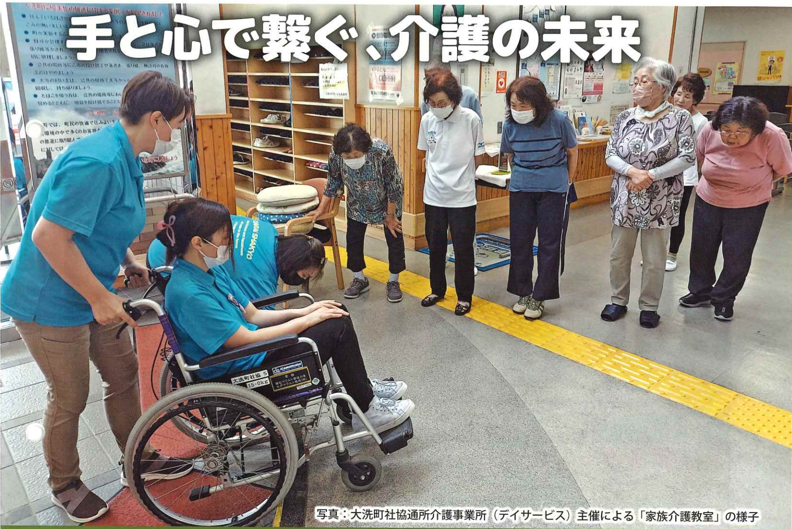
写真：大洗町社協通所介護事業所（デイサービス）主催による「家族介護教室」の様子