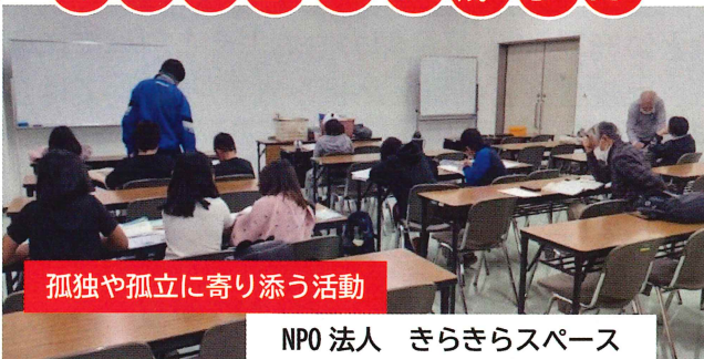
孤独や孤立に寄り添う活動