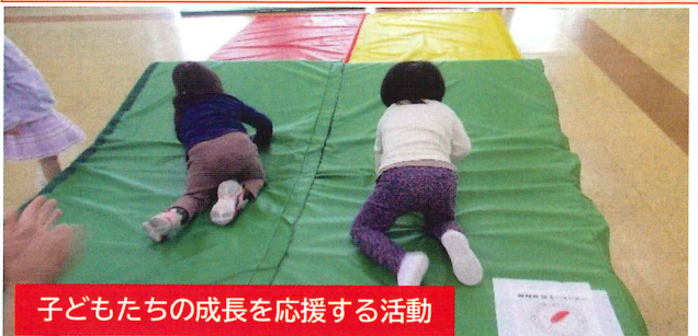
子どもたちの成長を応援する活動

「子育てが孤育てにならないように」をテーマに子ども食堂を開催しています。また、自習室としても、小中学生を対象に、食の支援をしながら、学習のための場所を提供しています。